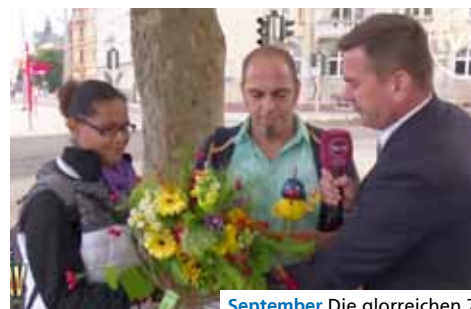
September Die glorreichen 7