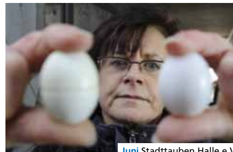
Juni Stadttauben Halle e.V.