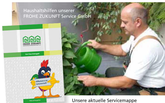
Unsere aktuelle Servicemappe