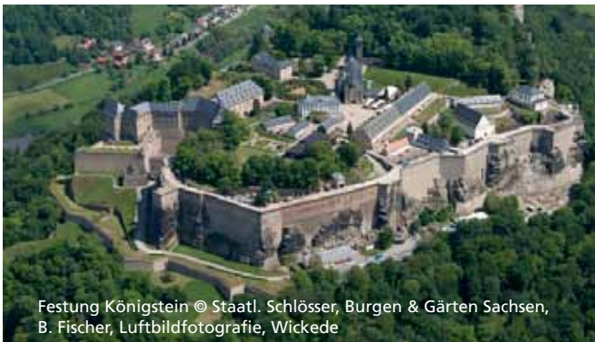
Festung Königstein