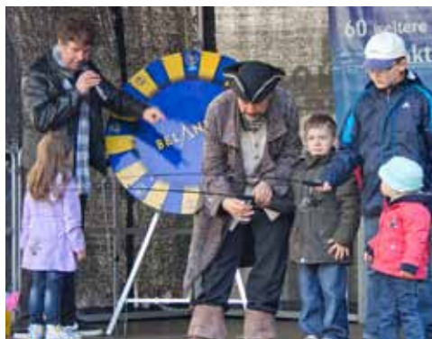
Angeln gehörte zur Piratenprüfung