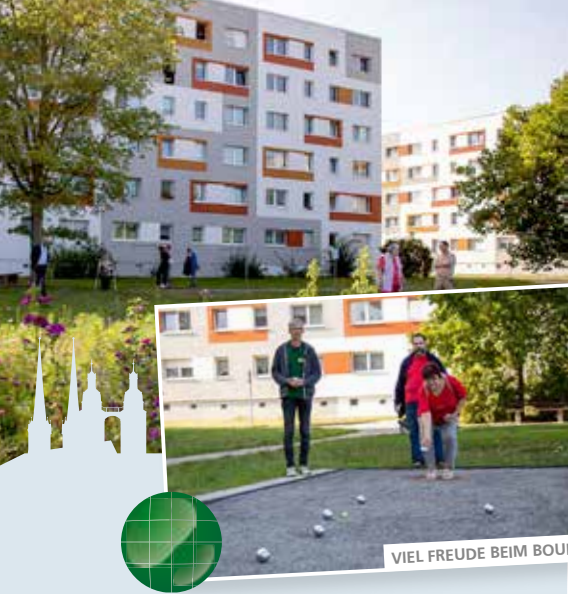
VIEL FREUDE BEIM BOULE