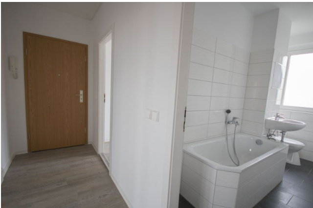
Flur / Bad