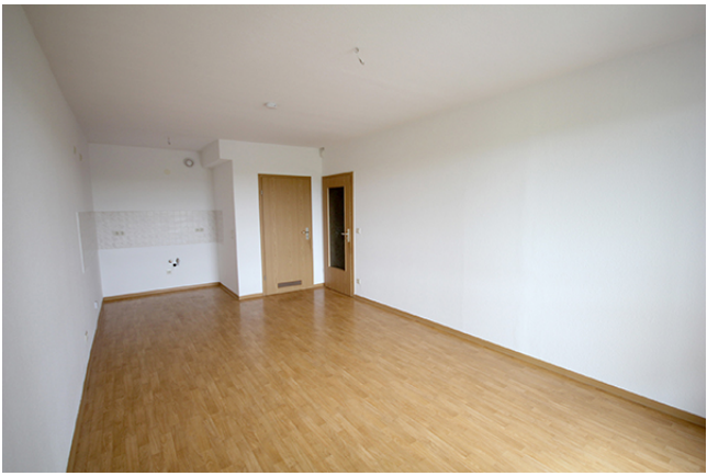
Wohn / Schlafbereich