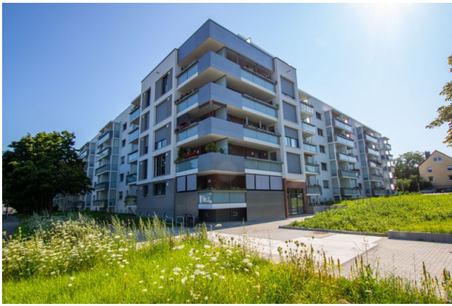
Neukirchner Weg 1 bis 11