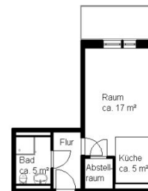
Maße am Bau können abweichen Maßstab 1 : 100 G010347_007_00.acp