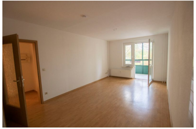
Wohn / Schlafbereich