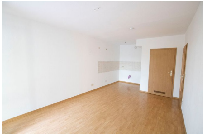
Wohn / Schlafbereich