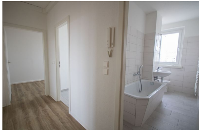
Flur / Bad