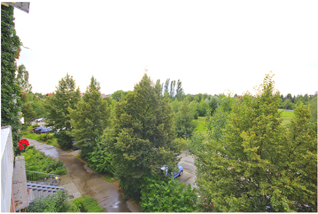
Bsp. Aussicht Balkon