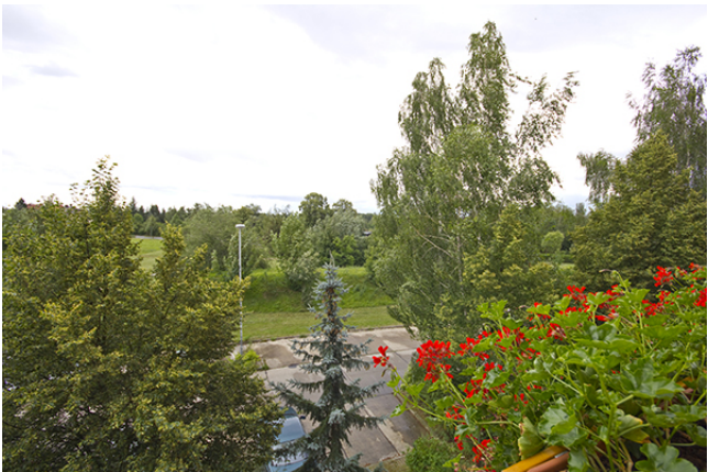
Bsp. Aussicht Balkon