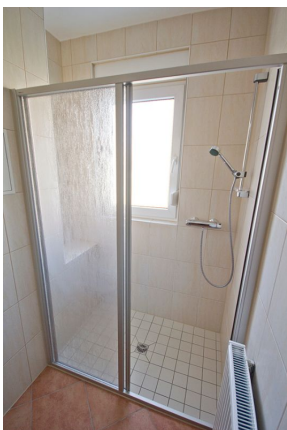
Dusche im Bad